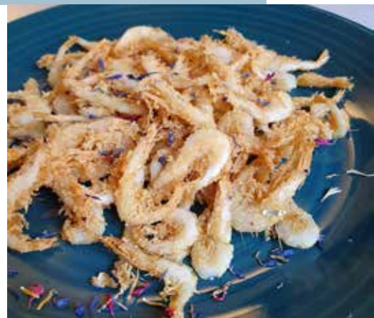
Gambas en vasito del Boca Boca, en forma de ceviche ofrecida por Galápagos y las poco habituales gambas de cristal que ofrece el Windsor.

un pan de los de las salchichas calentito y unas gambas troceadas a cuchillo con su salsa rosa fría. Lo sé, os preguntáis qué lleva la salsa y lo preguntamos. No se negaron a contarlo, lo único, que después tendrían que matarnos. ¿Qué ocurrió? Que estábamos a principio del artículo y no era plan.