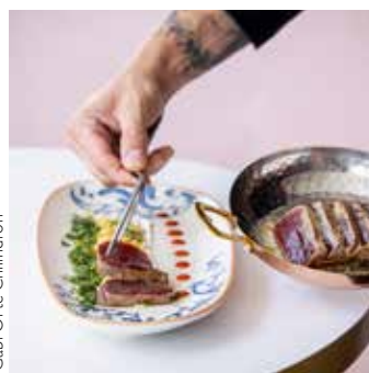
Vista general del comedor. El menú de los mejores platos, con el tataki a la derecha.

nos sobró a los dos comensales, con lo que mi tía la exótica dispuso de comida para el día siguiente, obsequio de su sobrino.