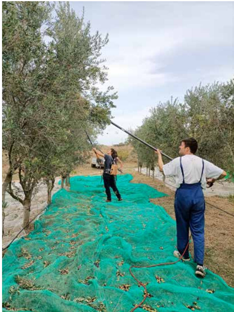
Recogiendo las olivas que, tras un cuidadoso proceso, se convertirán en aceite sólido, para untar.