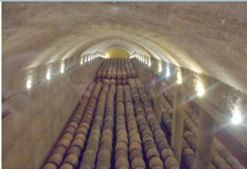
«Las 4000 barricas de la bodega descansan en ese inacabable calado en silencio y en penumbra».

Las habitaciones estándar se ubican en las tres plantas inmediatamente infe-