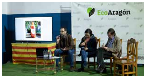
Aspecto general de la feria, paseo inaugural y mesa redonda.

debató acerca de la comunicación de los alimentos ecológicos. Allí se recordó la buena imagen con la que parten, que hará imprescindible, ante su previsible crecimiento y competencia por los mercados, la necesidad de una comunicación diferenciada –entendida como inversión– para cada uno de los productores y comercializadores.