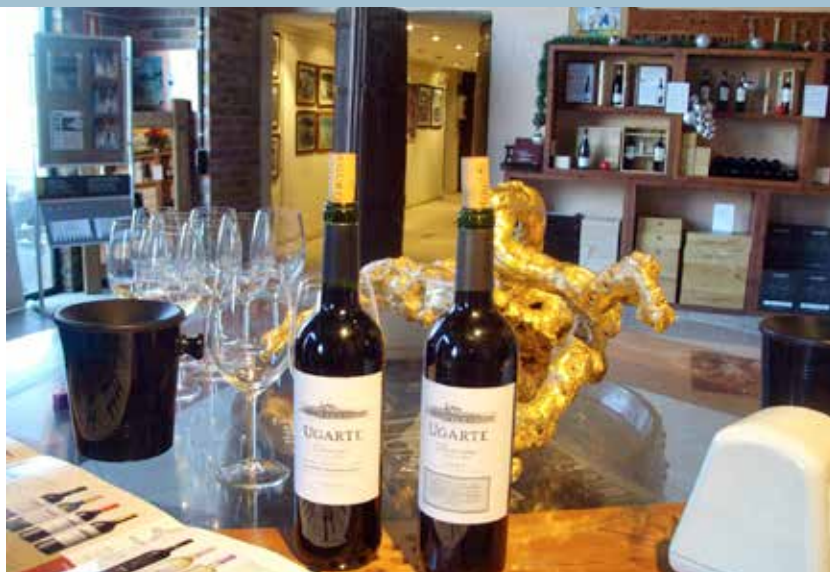
La estancia incluye la degustación del Ugarte Reserva, un vino con el marchamo de la bodega.

El gran momento de la cata llegó con la degustación del Ugarte Reserva, un vino con el indudable marchamo de la bodega, elaborado mayoritariamente con