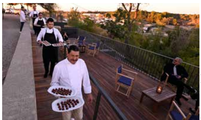
David del Val / RAF

El concierto se celebró en una nave de las Bodegas Raimat, cuyo patio acogió una degustación de productos leridanos. Paseo por los viñedos. Cuatro de los más afamados chefs de la provincia se encargaron del apartado gastronómico.