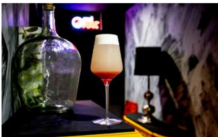
Participantes en la mesa redonda de apertura. Propuesta coctelera del Boulevardier.

Es decir, la mayoría de establecimientos que ofrecen cócteles en Zaragoza. Boulevardier, Moonlight, La Parthénope, Maremoto, Taller Clandestino, El Federal, Mai Tai Exótico, Bloody, Platerías 15, Chilimango Bar, Umalas, Sophia Bistró, El Viejo Negroni, Gonzo Bitter Bar y Camerino Bungalow. Incluso alguno de ellos organizaron cenas maridadas con diferentes bebidas.