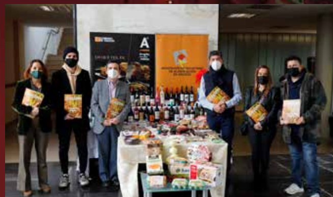
Ellos enviaron el cupón y ganaron el año pasado ¿Y tú?

El nombre de los ganadores se publicará en el número 86 de GASTRO ARAGÓN, que aparecerá en febrero de 2023 y en www.igastroaragon.com el mismo día del sorteo.