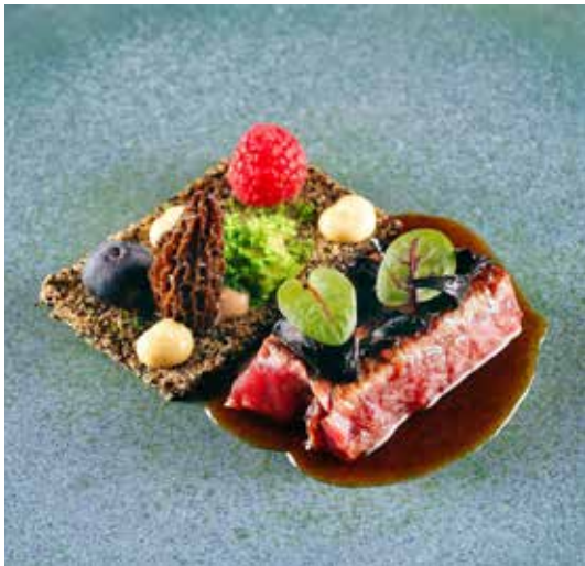
Gabi Orte / Chindrión

La Ternera en el Valle de Tena es uno de los platos de este menú.