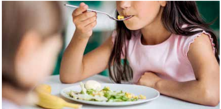
La comida escolar no es sólo una actividad comercial, un descanso de las clases o llenar los estómagos.

De esta necesidad de favorecer y facilitar el cambio a dietas sostenibles y saludables en las escuelas, nació el proyecto SchoolFood4Change –schoolfood4change.eu–. Dentro de sus objetivos, como así se recoge en su página web, está hacer que las comidas escolares sean agradables y saludables tanto para los niños como para el planeta, ya que lo que comen los niños y adolescentes en edad escolar repercute tanto en su salud como en la del medio ambiente, y más cuando se sabe que la biodiversidad es