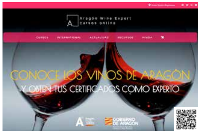
Portadas de las páginas web a las que alude el artículo, con los QR que enlazan directamente a los mismos.