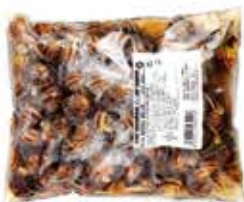
Caracoles de Aragón