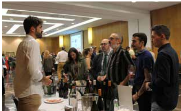
La afluencia de profesionales fue constante a lo largo de toda la jornada.

Dirigida a distribuidores, hostelería y tiendas especializadas, han estado presentes las principales referencias de cada una de las bodegas. «Estamos muy