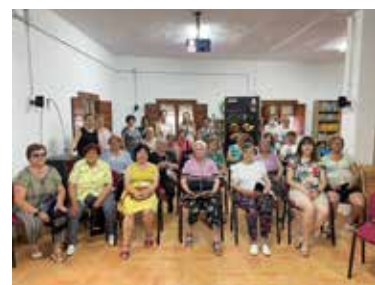
Sesión en Trasobares.

La Dirección General de Protección de Consumidores y Usuarios del Gobierno de Aragón, junto con Aragón, Alimentos Nobles, ha organizado unas charlas dedicadas a dar a conocer y educar al consumidor en el valor de los alimentos nobles de Aragón y la calidad diferenciada. Estas, se encuentran dentro del Programa de Educación Permanente 2022 de Consumo. Desde el pasado mes de marzo ya se han realizado dieciséis charlas, en las que han participado más de 300 personas, en pequeñas localidades aragonesas, como Torrecilla de Alcañiz, Barbastro o Trasobares. El objetivo es sencillo, dar a conocer nuestra rica despensa y poner en valor los alimentos nobles de Aragón, pues los consumidores aprecian –cada vez más– el origen y la producción de los alimentos. Al mismo tiempo, los asistentes han podido obtener información sobre qué características tienen y los requisitos que cumplen los alimentos de calidad diferenciada, y como distinguirlos en el punto de venta.