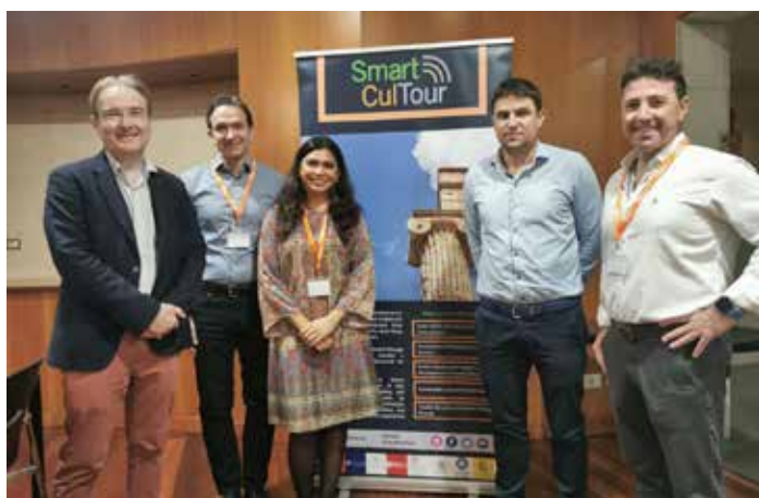
Huesca acogió la reunión del proyecto SmartCultTour con responsables de la UNESCO.

Fidelbo transmitió las muchas oportunidades que ofrece la UNESCO para el desarrollo turístico cultural sostenible, y que la provincia de Huesca debe confiar en su potencial natural y cultural para conformar una oferta atractiva para el turista. Por su parte Debrine facilitó las claves de la planificación de la gestión de los destinos turísticos desarrollando estrategias para el diseño y promoción de rutas culturales.