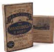
Anchoas Revilla Distribución exclusiva.