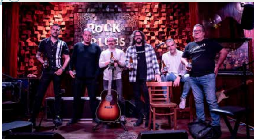
Los miembros del grupo ejeano, en el escenario del Rock&Blues, con el creador de la cerveza.

■ Ambar contribuirá a la promoción de la campaña 100k , la oferta conjunta de las estaciones de nieve de Candanchú y Astun . Imprimirá más de cuatro millones de contraetiquetas en próximos meses en los botellines que se comercializan en las cadenas de alimentación y en los bares de todo el país, que podrán canjearse en su página web.