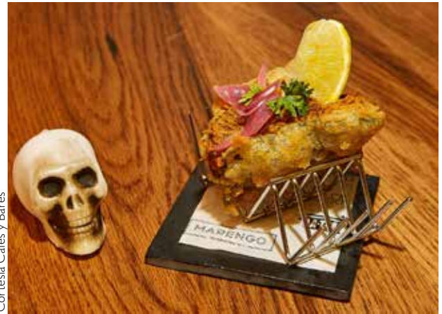
Cortesía Cafés y Bares

A la izquierda, la tapa de la Brasserie Fire, que no se podrá probar hasta dentro de unas semanas, cuando finalice su traslado. La del Marengo fue la más original.