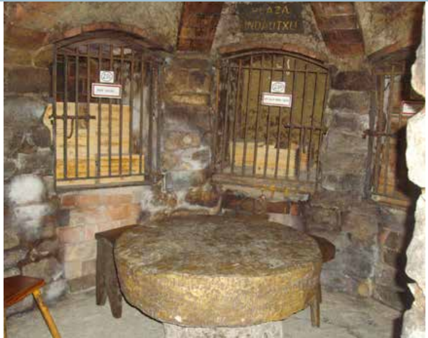
La cueva alberga un total de 380 nichos y ocho txokos, a los que pueden acceder los socios del club.

La visita a la bodega se realiza siempre previa reserva y es gratuita para los clientes alojados en el hotel. El acceso a la bodega se efectúa a través de la tienda que hace también las veces de recepción para los visitantes. La decoración es de tipo rústico, el espacio amplio, los techos altos y el ambiente luminoso, nada que ver con lo que nos espera a continuación. De camino a iniciar la visita guiada, pasamos junto a los ventanales del Asador Martín Cendoya, cerrado en el momento de nuestra visita dado lo temprano de la hora, el cual ofrece gastronomía típica de la zona, en contraposición al menú del hotel mucho más vanguardista e innovador, pero que oferta la posibilidad de maridar la comida con cinco vinos diferentes, propuesta verdaderamente interesante.