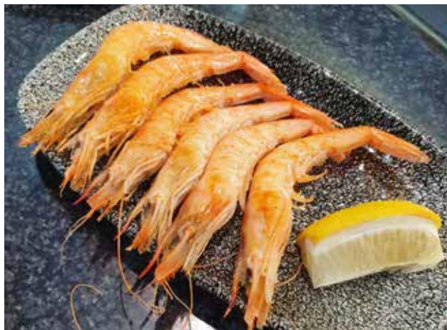
Diferentes propuestas de gambas; en el sentido de las agujas del reloj: Café de Levante, el Rincón de Costa, Taberna El Papagayo y Casa El Pescatero.